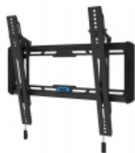
WL35-550BL14 - TruVision - Staffa parete Monitor 32-66" inclinabile

Staffa a muro 3 snodi nera per LCD 32-60"