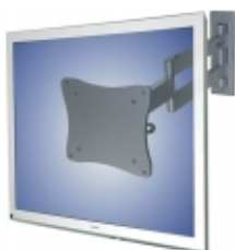
FPMA-W830 - TruVision - Staffa muro 3 snodi argen per LCD 10-24"

Staffa a muro fissa nera ultrasottile per LCD 10-30"