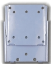
FPMA-W25 - TruVision - Staffa muro fissa nera per LCD 10-30"

Staffa a soffitto nera h.79-129cm per LCD 10-26"