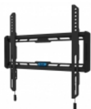
WL30-550BL14 - TruVision - Staffa parete per Monitor 32"- 66" fissa

Staffa a muro 3 snodi nera per LCD 32-60"