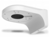
PFB203W - Dahua - Staffa a parete 122x76x160mm